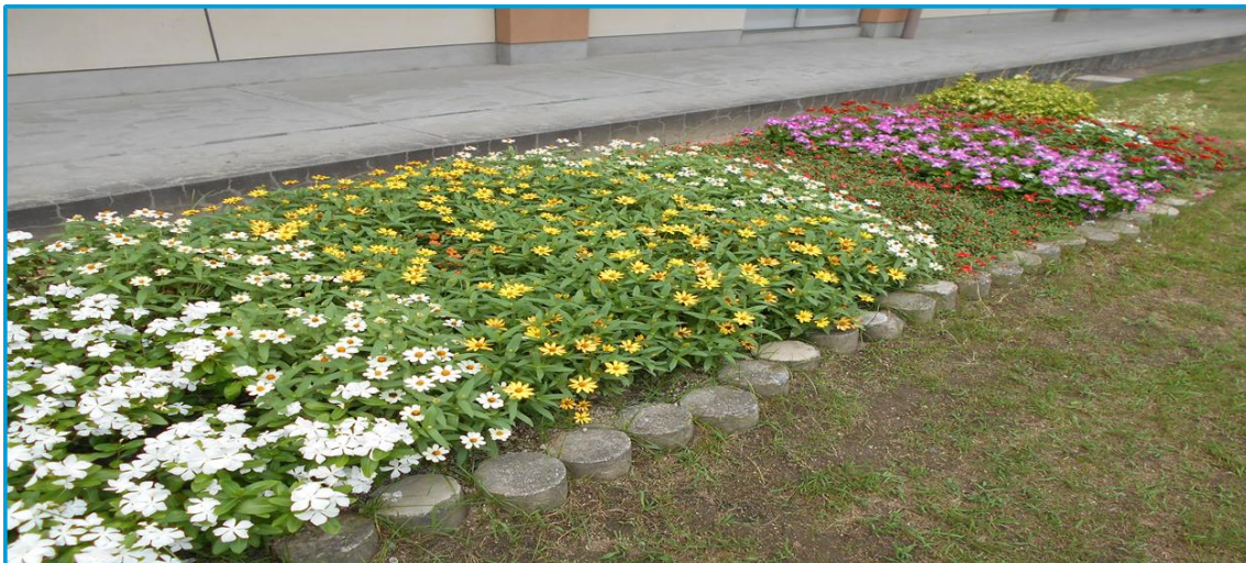
↑各クラス環境委員で植えた中庭の花壇