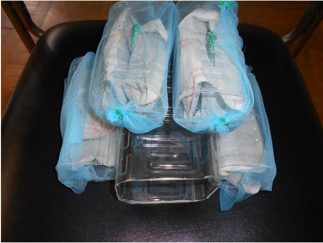
カイロ設置用の装置